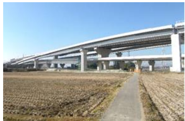
大和御所道路三宅IC橋・寺川橋鋼上部工事