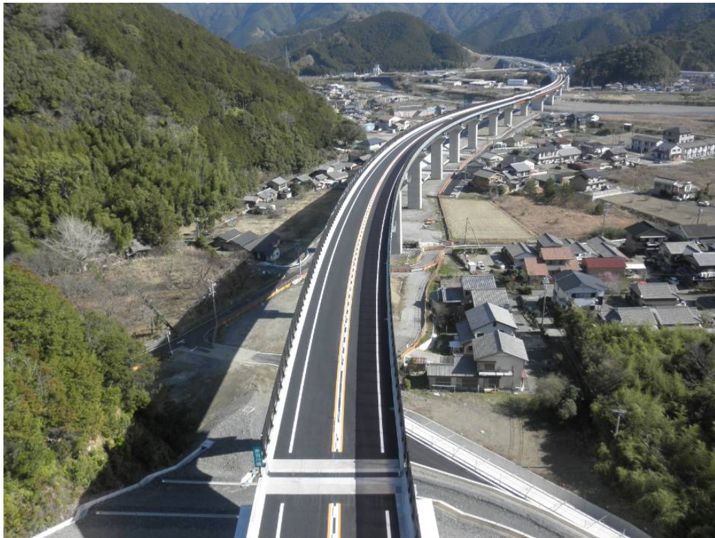
平成 23 年度紀勢線 赤羽川橋出垣内鋼上部工事