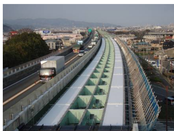
平成 24 年度 1 号静岡清島坂高架橋西地区鋼上部工事