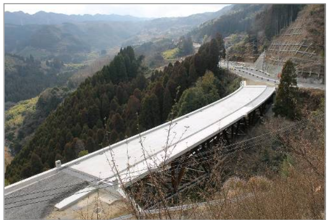
平成24年度交付国改大第13号橋梁整備工事 (国道 442 号 大分市大字上詰)