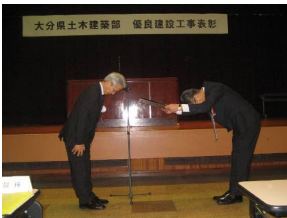
表彰を受ける丸山営業本部長