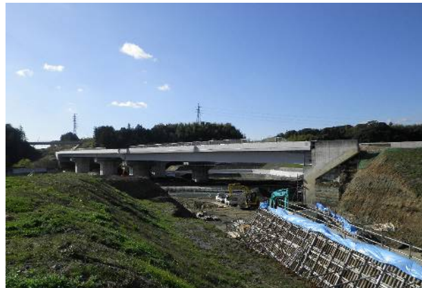
東海環状東員高架橋鋼上部工事