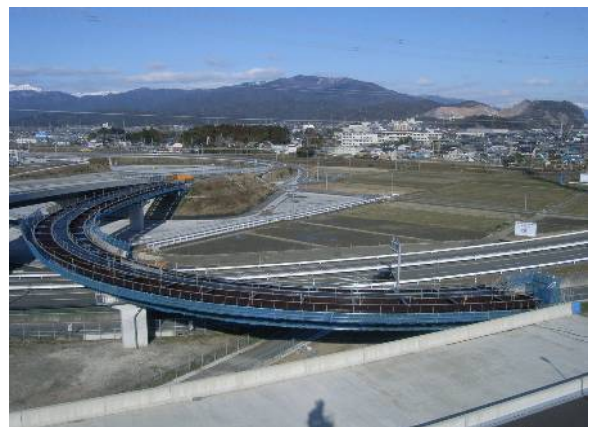
平成25年度東海環状大垣西IC・Aランプ橋鋼上部工事