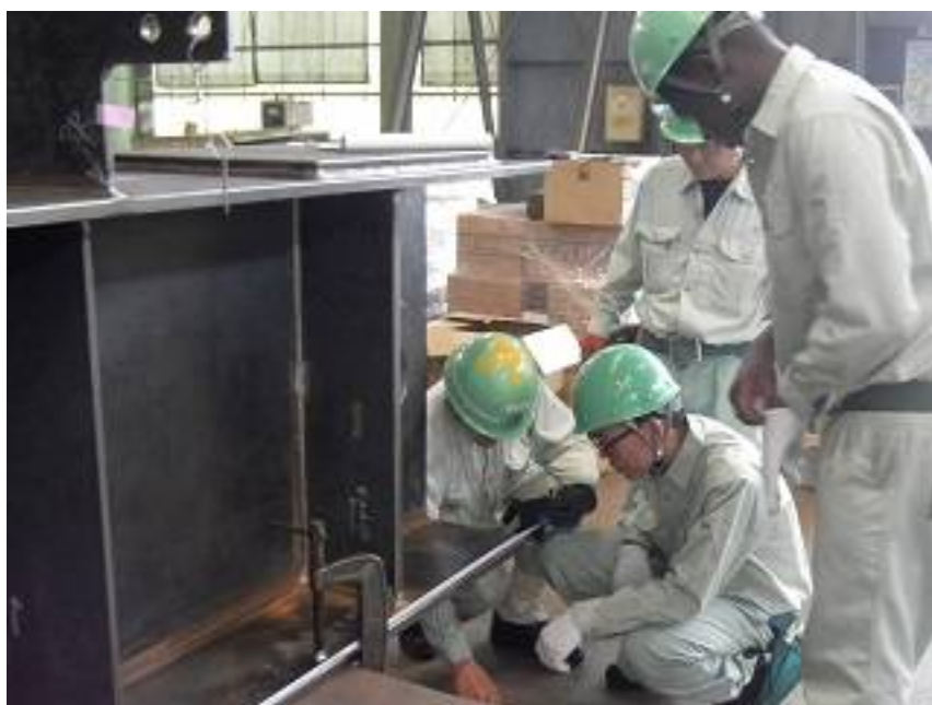
品質管理業務体験