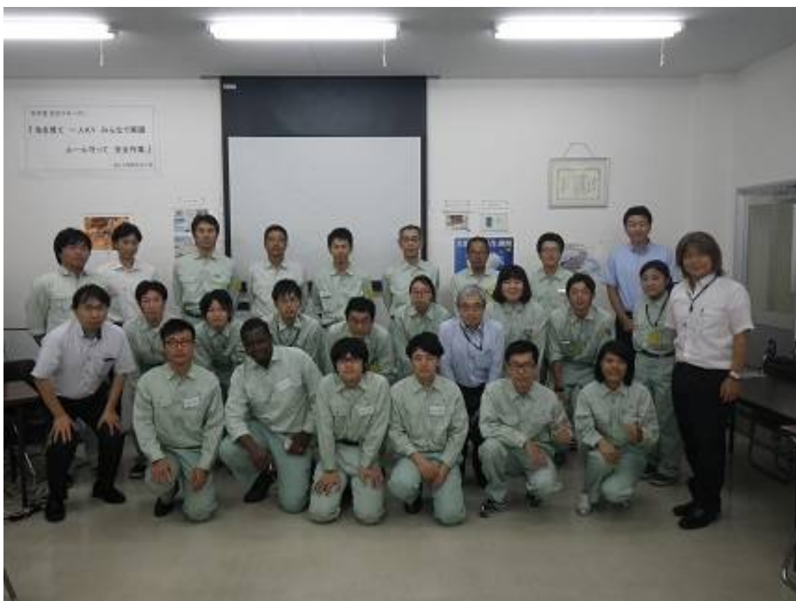
インターンシップ終了後の記念撮影

今後もインターンシップを開催し、鋼橋及び鋼構造物を身近に感じて頂けるよう活動を続けていきます。