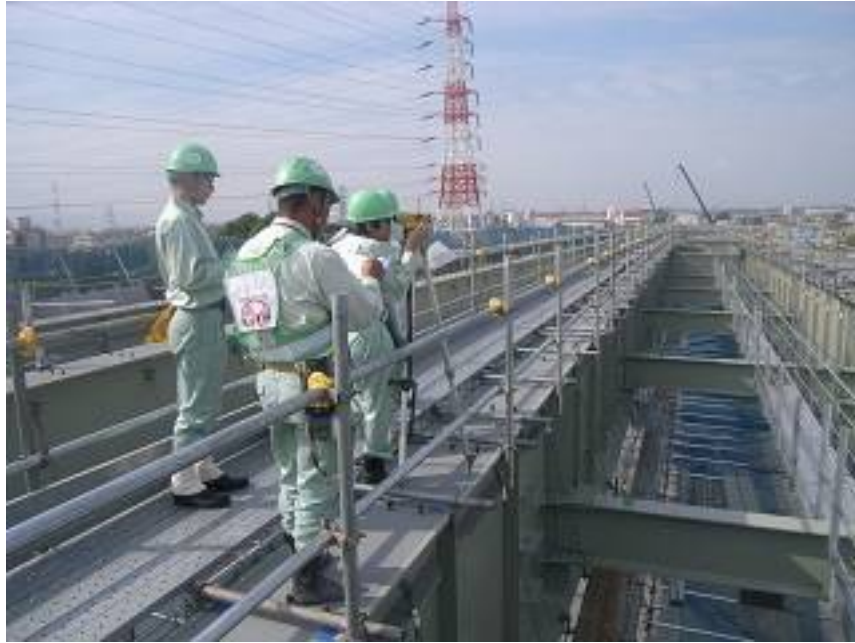
架設現場の施工管理体験