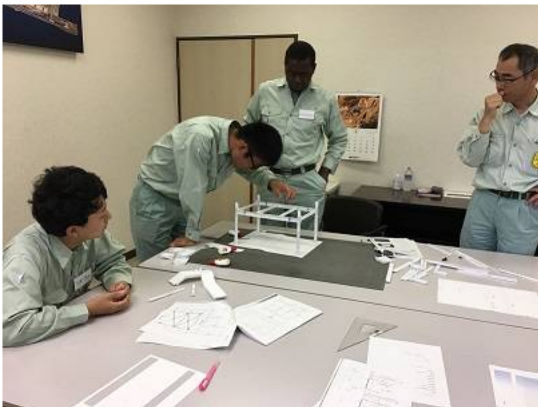
鉄骨模型作りの風景