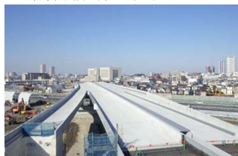
東京外環自動車道 稲荷木橋(鋼上部工)北工事