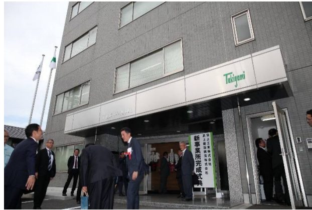
新事業所完成式典