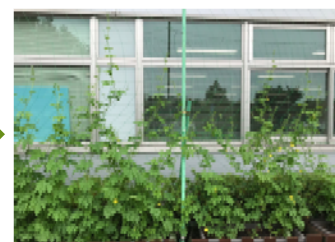
葉が緑になり、蔓も伸びた