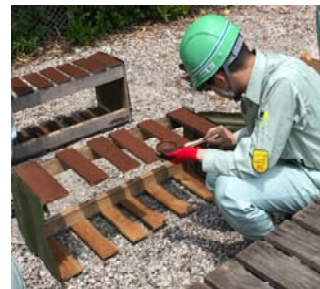
塗装・シート貼り