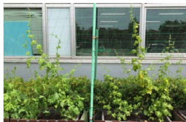
葉が黄色く小さい