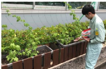
追肥しているところ