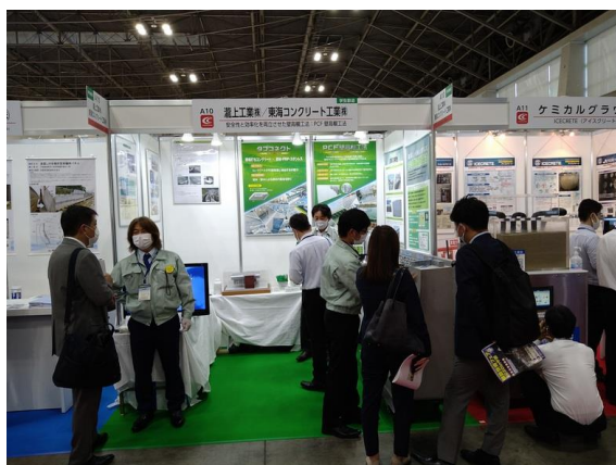
来訪者への製品紹介