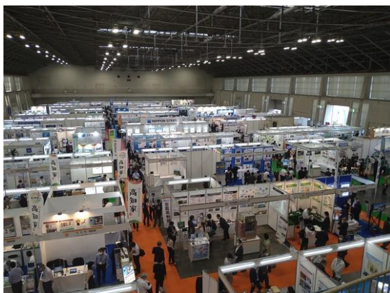
会場の様子 (吹上ホール)

当ブースでは、東海コンクリート工業(株)と共同で開発・販売を進めている「PCF埋設型枠」をはじめ、今年NETISに登録された「タフコネクト」、その他「RTコート」や「TMブリッジ」を紹介し、2日間で約200名の皆様に来訪いただきました。