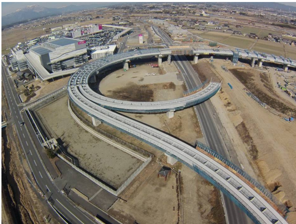
平成 24 年度東海環状 東員C・Dランプ橋鋼橋上部工事