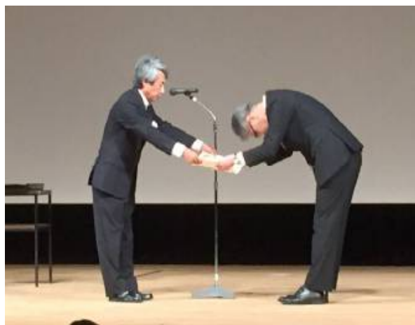
表彰を受ける丸山営業本部長