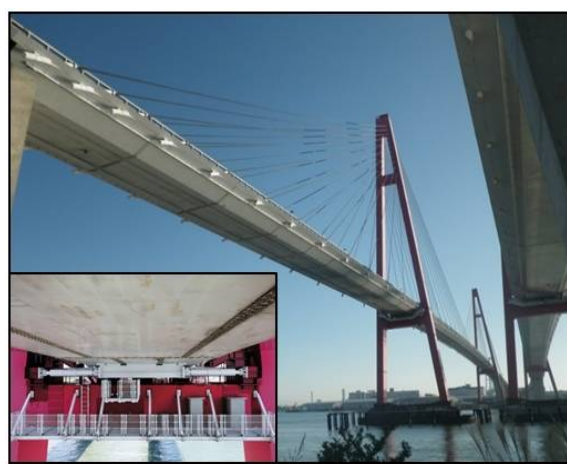
伊勢湾岸道路名港西大橋 (上り線) 耐震補強工事